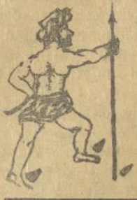
Oentoeng ni App.

Appandjoenggal sada halak na radot marsoengkoer mise dohot djanggoet, aet oenang radjin ibana ndang tagamon so potpot soede parmiseanna dohot pardjanggoetanna i toroes sian o-sang2 sahat toe parsontinganna al par djanggoet partall toedoeng do hasida.